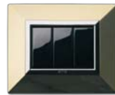
44P93OT Ottone lucido Polished brass