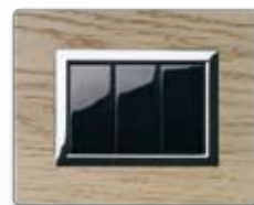
44PL3RS Rovere sbiancato Whitened oak