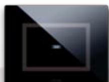
44PVTC01NAL Per 1 comando "a scomparsa" For 1 "hidden" control