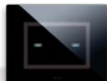
44PVTC02NAL Per 2 comandi "a scomparsa" For 2 "hidden" controls