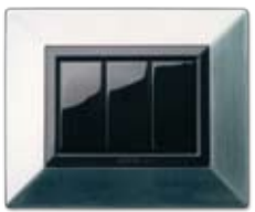
44P93NCS Nichel spazzolato Brushed nickel