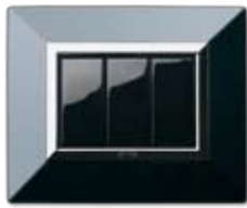
44P93NAL Nero assoluto lucido Polished absolute black NEW