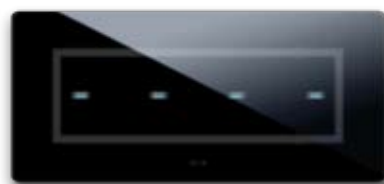
44PVTC04NAL Per 4 comandi "a scomparsa" For 4 "hidden" controls