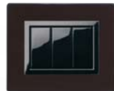
44PL3WG Wenghè Wengè