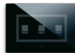
44PVTC03NAL/P Per 3 comandi "a scomparsa" finestre per etichette di personalizzazione For 3 "hidden" controls window for customization labels