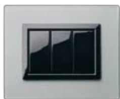
44PV3GO Grigio argentato finitura satinata Frosted silver grey