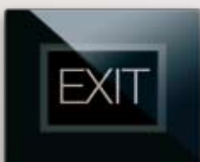
44PVTC76NAL Per modulo segnalazione luminosa/illuminazione personalizzabile For 1 "hidden" light signal/lighting module