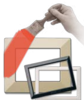
44P93PERS Placca verniciabile Paintable front plate