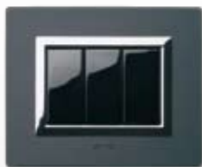
44PA3ANS Alluminio antracite spazzolato Anthracite brushed aluminium