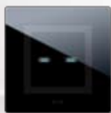
44PVTC22NAL Per 2 comandi "a scomparsa" per scatola tonda For 2 "hidden" controls for round boxes