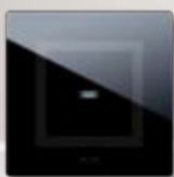
44PVTC21NAL Per 1 comando "a scomparsa" per scatola tonda For 1 "hidden" control for round boxes