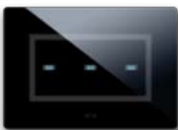
44PVTC03NAL Per 3 comandi "a scomparsa" For 3 "hidden" controls