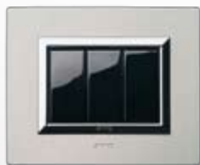
44PA3ALS Alluminio naturale spazzolato Natural brushed aluminium