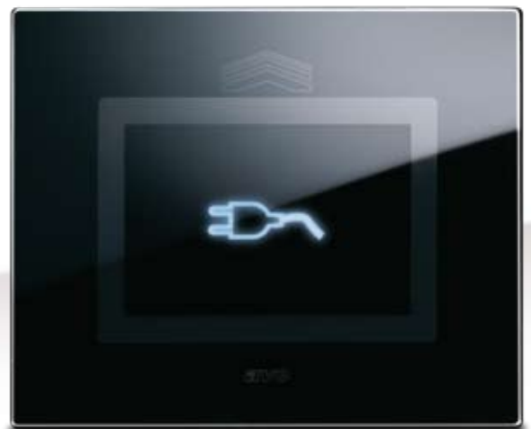
Placca scorrevole Ave Touch copre le prese con eleganti sistemi a scomparsa. Ave Touch sliding front plate covers the socket outlet with refined hidden installations.

P incipali simbologie disponibili per le segnalazioni negli ambienti pubblici.