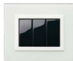
44PV3VO Rosso Pompei finitura satinata Frosted water green