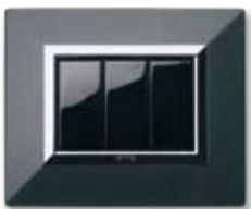
44P93GSM Grigio scuro metallizzato Metallic dark grey