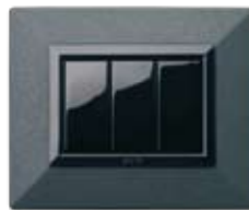
44P93GF Grafite Graphite