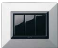
44P93AO Argento opaco Matt silver