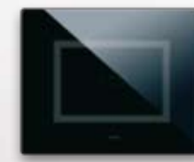
44PVTCN3NAL A scivolamento per copertura 3 moduli standard S44 nessuna simbologia frontale Sliding for covering 3 stan- dard modules S44 no symbol