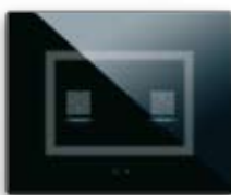
44PVTC02NAL/P Per 2 comandi "a scomparsa" finestre per etichette di personalizzazione For 2 "hidden" controls window for customization labels