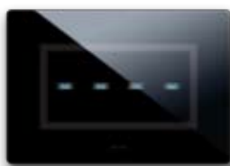
44PVTC4NAL Per 4 comandi "a scomparsa" For 4 "hidden" controls