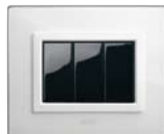
44PV3BL Bianco lucido finitura lucida Clear waith NEW