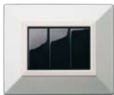
44P93BMC Bianco lucido micalizzato Micalized polished white