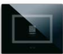
44PVTC01NAL/P Per 1 comando "a scomparsa" finestra per etichette di personalizzazione For 1 "hidden" control window for customization labels