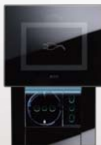
44PVTC3NAL A scivolamento per copertura 3 moduli standard S44 simbolo "spina" frontale Sliding for covering 3 standard modules S44 "plug" symbol