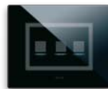
44PVTC3NAL/P Per 3 comandi "a scomparsa" finestre per etichette di personalizzazione For 2 "hidden" controls window for customization labels