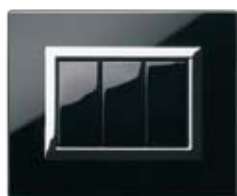
44PV3NAL Nero assoluto finitura lucida Clear absolute black