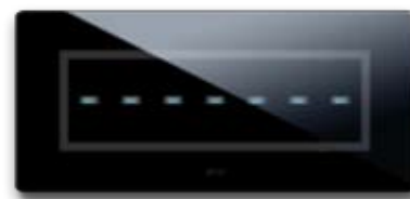
44PVTC7NAL Per 7 comandi "a scomparsa" For 7 "hidden" controls