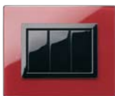
44PV3RPL Rosso Pompei finitura lucida Clear Pompeian red