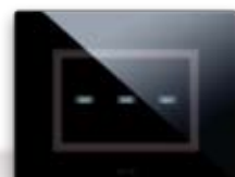
44PVTC3NAL Per 3 comandi "a scomparsa" For 3 "hidden" controls