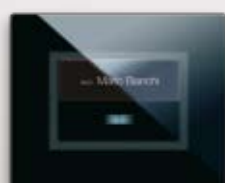
44PVTC88NAL Per modulo pulsante "a scomparsa" con targhetta portanome For 1 "hidden" push-button with name tag module